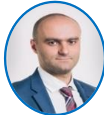
РУКОВОДИТЕЛЬ К.А.ХАДИКОВ заместитель председателя Правительства Астраханской области – министр экономического развития Астраханской области