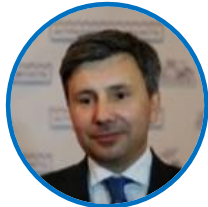
КУРАТОР А.В.ШАРЫКИН вице-губернатор – председатель Правительства Астраханской области